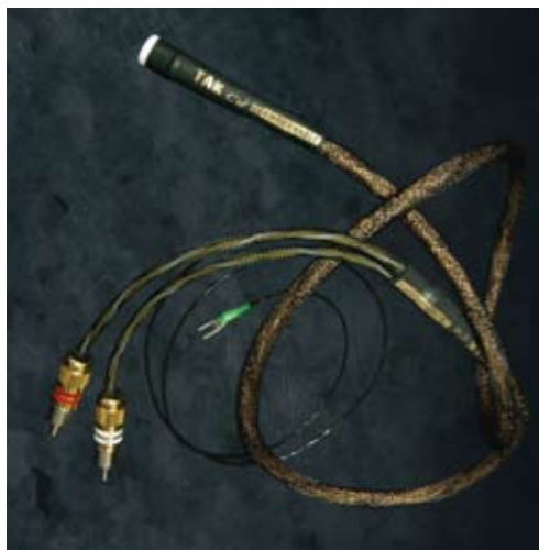
DAS VOLLE SORTIMENT: Kimber versorgt jede, wirklich jede Komponente mit den richtigen Leiterbahnen. Neben Stromkabeln bietet die Company mittlerweile auch Tonarmkabel an.