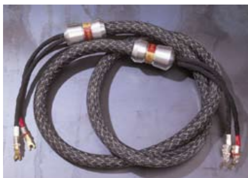
DAS MAXIMUM: Im Select KS-3038 hat die Company aus Ogdon, Utah, ihr Know-how geballt. Ein Lautsprecherkabel für grob gerechnet 2500 Euro pro Meter.